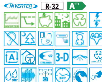
FTXA-AW FTXA-BS FTXA-BB RXA20-35A RXA42-50B